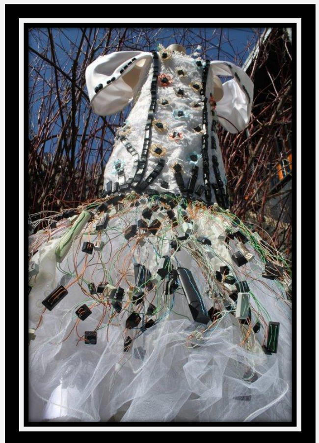
Robe de mariée